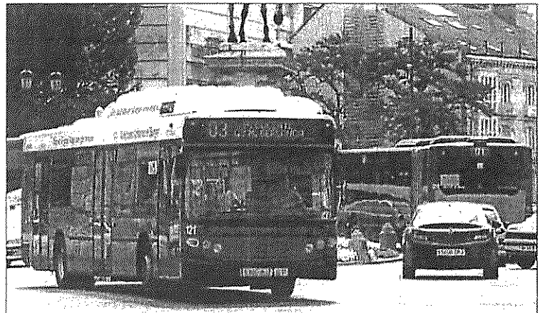
Varios autobuses municipales circulan por la plaza del Cid.